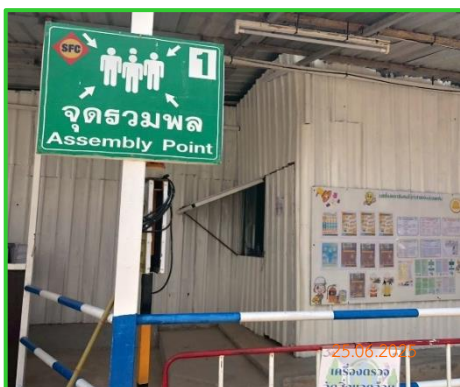
ภาพที่ 2-14 จุดรวมพล