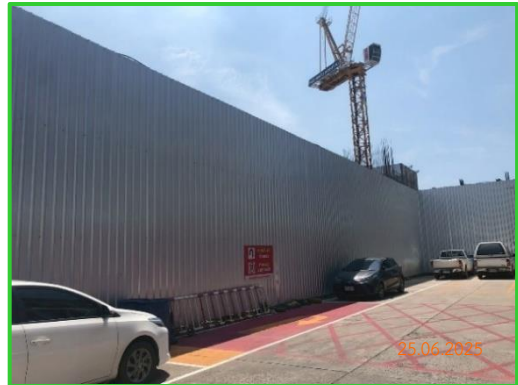
ภาพที่ 2-2 รั้วโดยรอบพื้นที่โครงการ