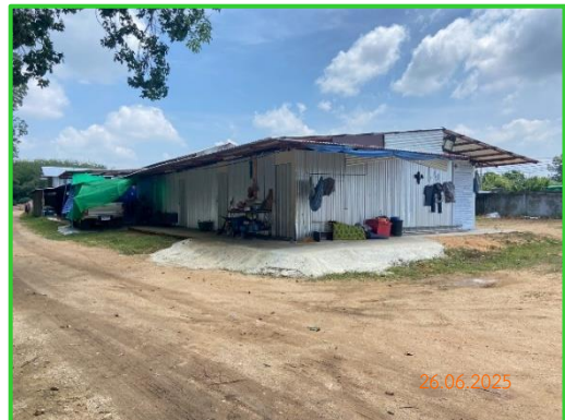
ภาพที่ 2-27 บ้านพักคนงาน