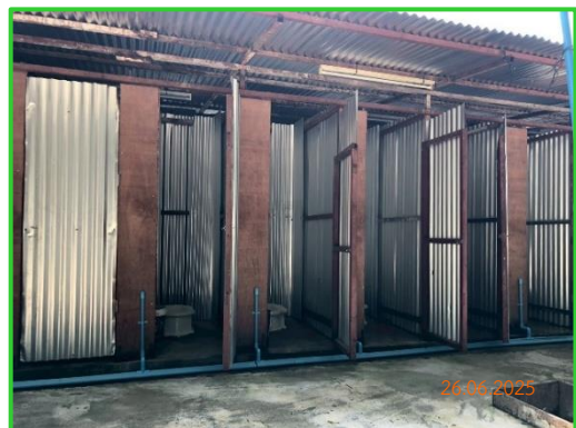
ภาพที่ 2-29 ห้องส้วมบริเวณพักคนงาน