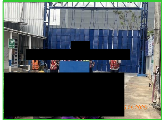
ภาพที่ 2-25 การอบรมกับคนงานก่อนเริ่มงานทุกวัน