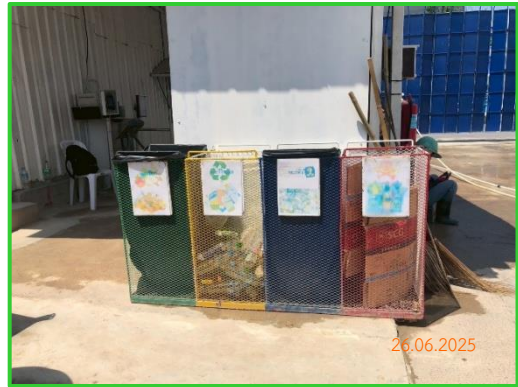
ภาพที่ 2-17 ถังรองรับมูลฝอยในพื้นที่โครงการ