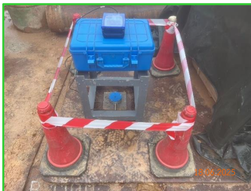
ภาพที่ 2-12 การตรวจวัดแรงสั่นสะเทือนภายในโครงการ