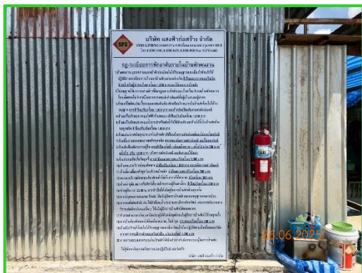
ภาพที่ 2-22 กฎระเบียบภายในพื้นที่ก่อสร้างและบ้านพักคนงาน