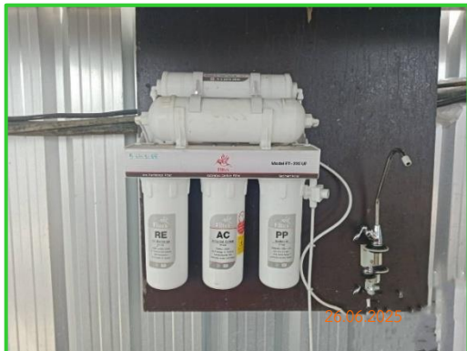
ภาพที่ 2-26 ถังน้ำดื่มภายในพื้นที่โครงการ