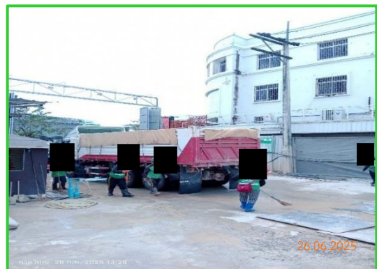
ภาพที่ 2-6 การปิดคลุมรถบรรทุก