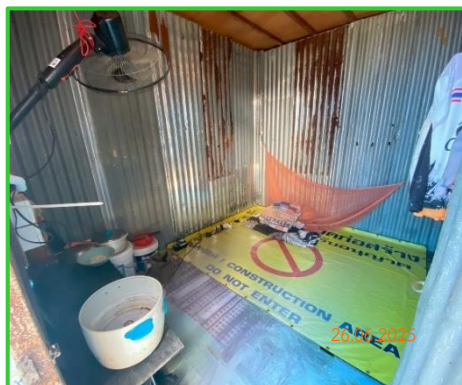
ภาพที่ 2-28 ห้องพักคนงาน