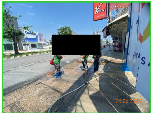
ภาพที่ 2-4 พนักงานคอยดูแลความสะอาดโครงการ