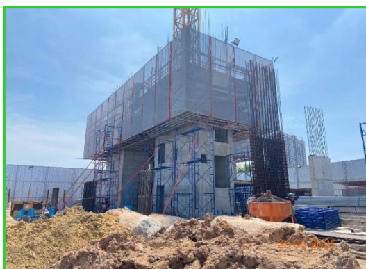
ภาพที่ 2-7 โครงสร้างอาคาร