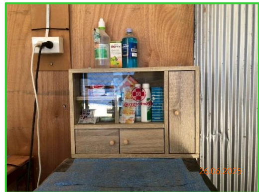
ภาพที่ 2-35 ตู้ยาสามัญประจำบ้าน