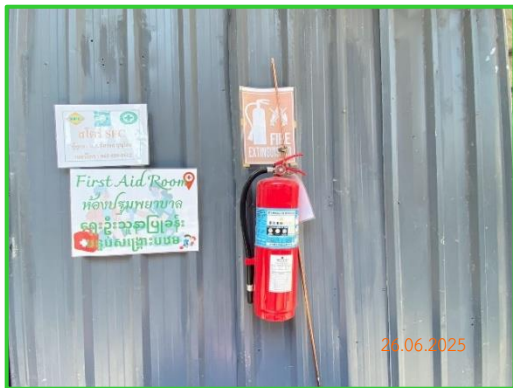
ภาพที่ 2-18 ถังดับเพลิงในพื้นที่ก่อสร้าง