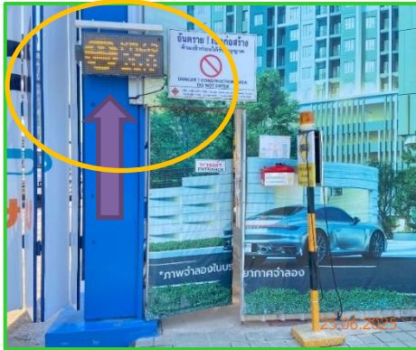
ภาพที่ 2-9 ป้ายแสดงผลการตรวจวัด PM2.5