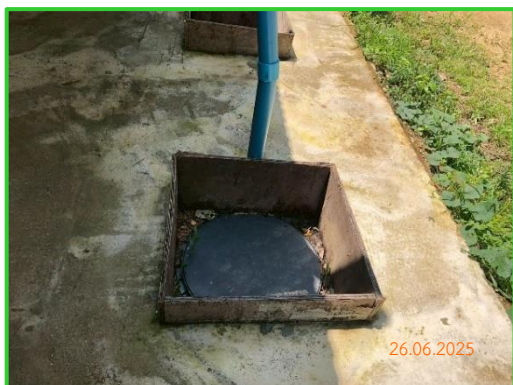
ภาพที่ 2-30 ถังบำบัดสำเร็จรูปบ้านพักคนงาน