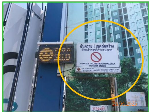
ภาพที่ 2-19 ป้ายเตือนเขตก่อสร้าง