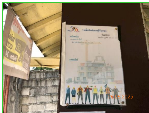
ภาพที่ 2-38 รายชื่อติดต่อผู้รับเหมาก่อสร้าง