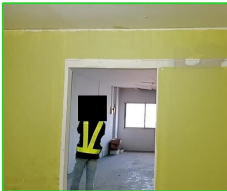
ภาพที่ 2-11 ตรวจสอบภายในอาคารบริเวณใกล้เคียงโครงการ