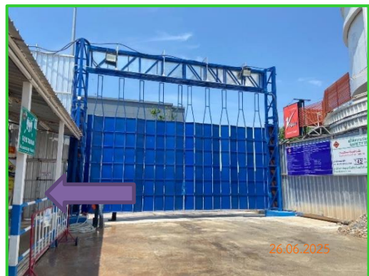
ภาพที่ 2-23 ทางเข้าบริเวณหน้าโครงการ