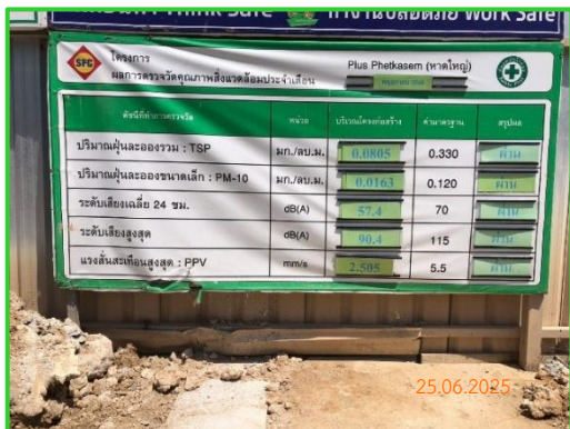
ภาพที่ 2-5 ป้ายแสดงผลการตรวจวัดคุณภาพสิ่งแวดล้อม