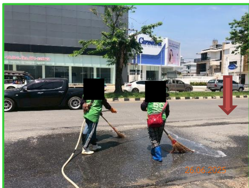
ภาพที่ 2-20 ถนนเพชรเกษม