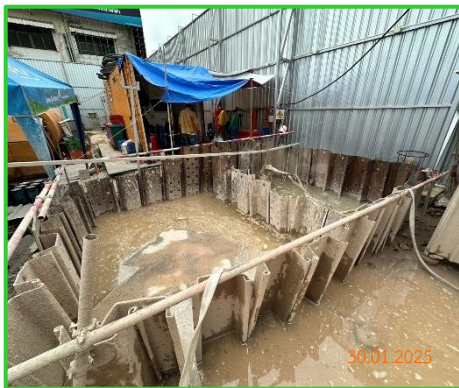
ภาพที่ 2-3 บ่อดักตะกอนบริเวณทางเข้าพื้นที่โครงการก่อสร้าง