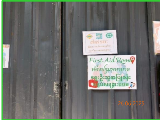
ภาพที่ 2-24 ห้องปฐมพยาบาล