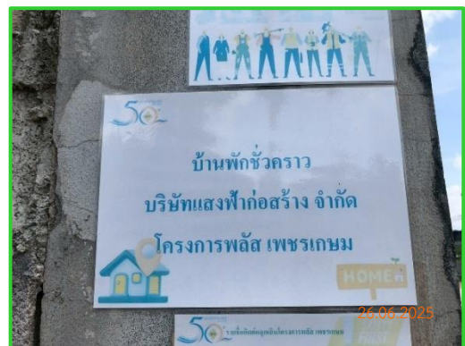
ภาพที่ 2-37 ป้ายชื่อบ้านพักคนงาน