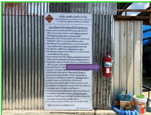
ภาพที่ 2-34 ถังดับเพลิงแบบมือถือติดตั้งไว้บริเวณบ้านพักคนงาน