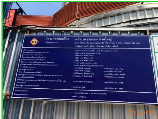
ภาพที่ 2-1 ป้ายชื่อโครงการ