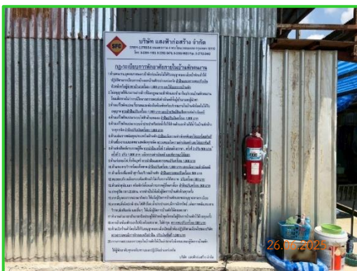
ภาพที่ 2-36 กฎระเบียบในบ้านพักคนงาน