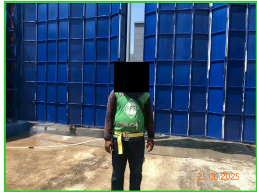
ภาพที่ 2-10 อุปกรณ์ป้องกันอันตรายส่วนบุคคล