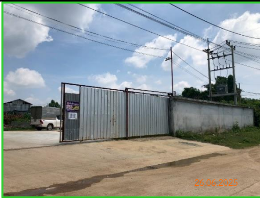
ภาพที่ 2-32 ประตูทางเข้าและล้อมรั้วรอบบ้านพักคนงาน