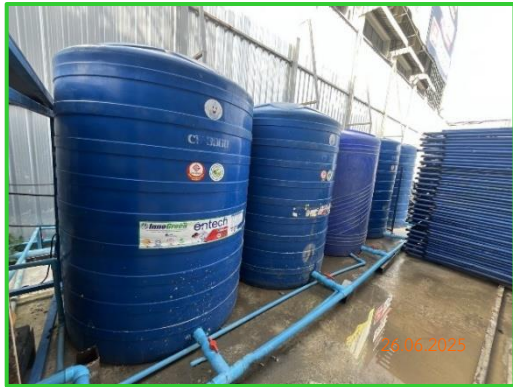
ภาพที่ 2-16 ถังน้ำสำรองภายในพื้นที่โครงการ