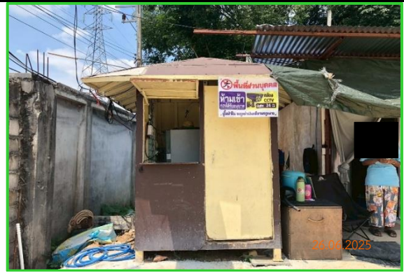
ภาพที่ 2-33 ป้อมยามบ้านพักคนงาน