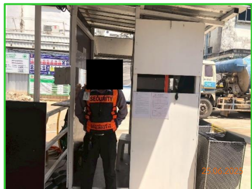
ภาพที่ 2-13 เจ้าหน้าที่รักษาความปลอดภัย